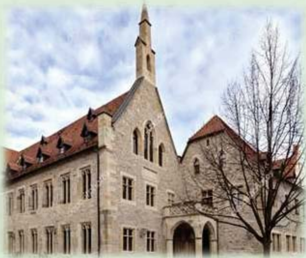
Convento de los Agustinos en Erfurt

Después del desayuno, visita guiada de la ciudad de Weimar, lugar de residencia de figuras literarias tan destacadas como Johann Wolfgang von Goethe y Friedrich Schiller. Continuación a Erfurt. Allí visitaremos el convento agustino donde vivió Lutero como monje, así como la ciudad, con el puente de madera más largo de Europa. Plaza de la catedral con su impresionante escalinata. Regreso a Weimar. Cena y alojamiento.