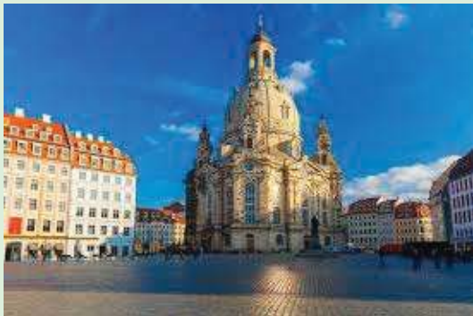
HYPERION HOTEL DE DRESDEN