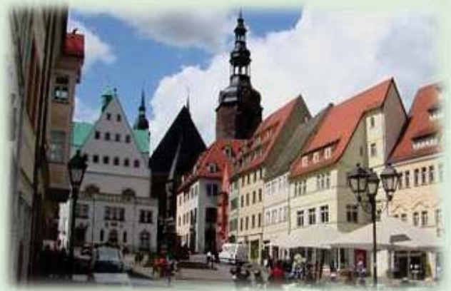
Eisleben: aquí nació y murió Lutero

Salida hacia Eisleben. En 1996 la UNESCO añadió los monumentos conmemorativos de Lutero a su lista del patrimonio mundial, por lo que la ciudad se titula “Ciudad de Martín Lutero”- Eisleben. Aquí, en la región de los condes de