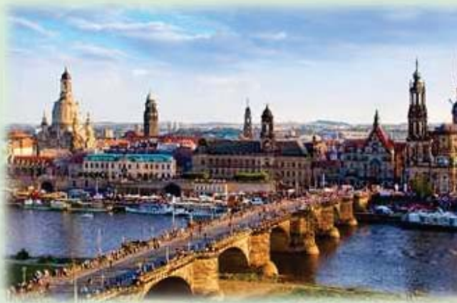
Dresden, con el río Elba

Debido a sus numerosos edificios antiguos, como la ópera de Semper o el palacio imperial Zwinger, Dresden es considerada una de las ciudades más bellas de Alemania. Por la mañana, haremos una visita guiada de la ciudad donde descubriremos la iglesia de