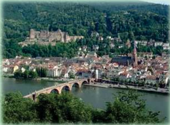
Heidelberg, con su castillo

Día 1º (11 septiembre, 2021) Madrid - Frankfurt – Heidelberg – Würzburg