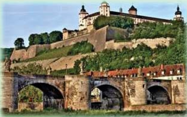
Würzburg, con su castillo

Vuelo a Frankfurt con Air Europa (UX1503). Salida: 07.25 / Llegada: 10.05. Recepción por nuestro guía y continuación del viaje a Heidelberg. Esta es la ciudad universitaria más antigua de Alemania y uno de los lugares más visitados debido a su idílica ubicación a las orillas del río Neckar. Almuerzo y visita de la parte antigua de la ciudad y del castillo en Heidelberg. Continuación a Würzburg. Cena y alojamiento en Würzburg.