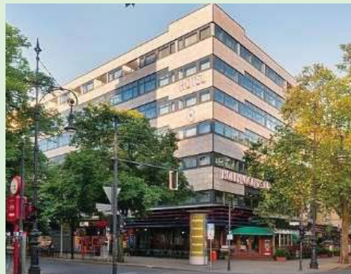
HOTEL HOLLYWOOD MEDIA DE BERLÍN