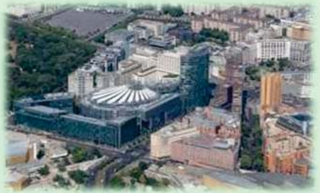
Berlín: plaza de Postdam