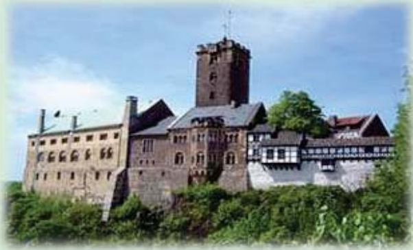
Castillo de Wartburg, refugio de Lutero

excepcional belleza arquitectónica. Cena y alojamiento en Weimar.