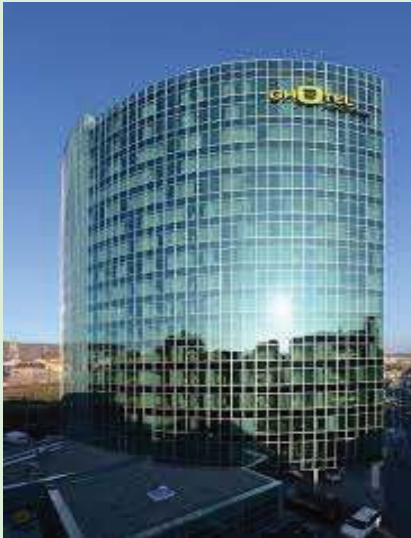
GHOTEL DE WÜRZBURG

Berlin: Hollywood Media Hotel**** https://www.filmhotel.de/en/startseite/