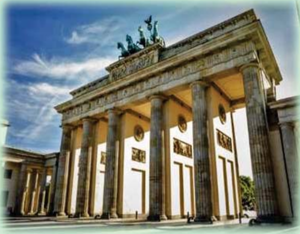
Berlín: puerta de Brandeburgo

Almuerzo. A la hora acordada, traslado al aeropuerto. Vuelo a Madrid con Iberia (IB 3672). Salida: 19:40 / Llegada: 22.45.