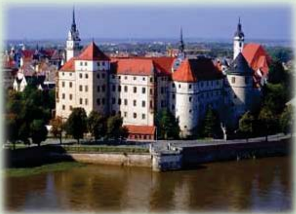
Torgau: palacio Hartenfels