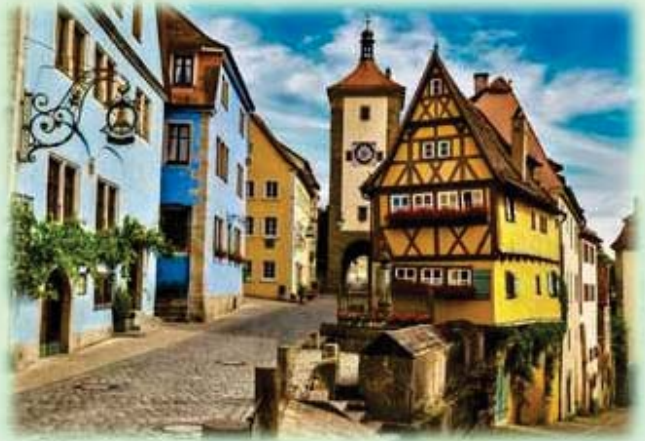
Rothenburg ob der Tauber

Würzburg, conocida como “La joya del río Meno”, es considerada como una de las ciudades más hermosas de Alemania. Visitaremos, entre otros lugares, la Iglesia de los Agustinos en el centro de la ciudad. Almuerzo. Después, salida hacia Rothenburg ob der Tauber, una de las ciudades más bellas y antiguas de la “Ruta Romántica”. Paseo por la ciudad de ensueño para los románticos. Regreso a Würzburg. Cena y alojamiento en Würzburg.