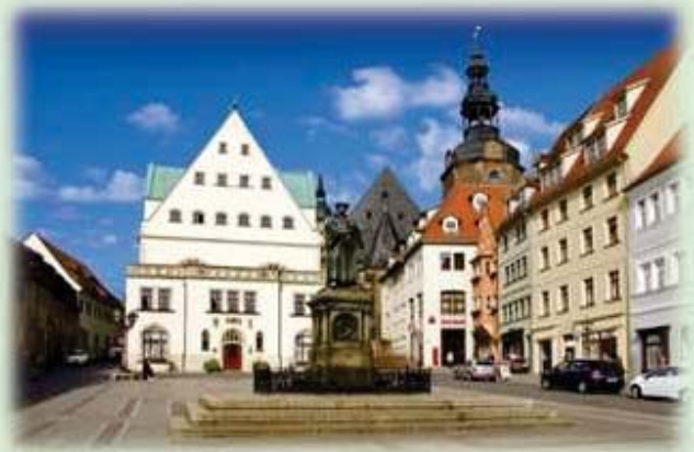
Wittenberg: las 95 tesis

Después del desayuno, salida hacia Wittenberg: culmen de la ruta de Lutero. En este lugar Lutero ganó notoriedad mediante la publicación de sus 95 tesis en la puerta de la iglesia del Palacio que dio inicio al movimiento que se convertiría en la Reforma. Almuerzo. Visita de Wittenberg con las iglesias del Castillo y de Santa María. Conoceremos también la Casa de Lutero, convertida hoy en el museo más importante sobre la historia de la