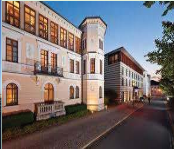
HOTEL DORINT DE WEIMAR