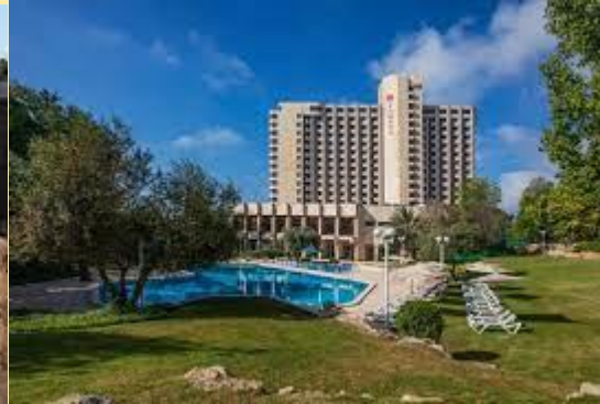
Hotel Royal Ramada (Jerusalén)