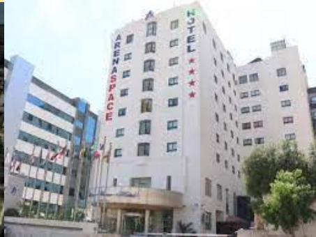
Hotel Arena Space (Amman)