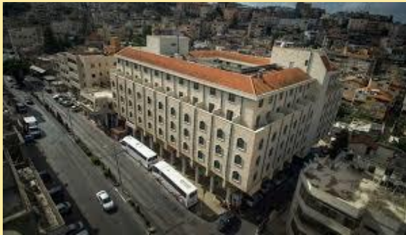
Hotel Mary's Well (Nazaret)

Petra (2 noches): Panorama Hotel / Jerusalén (4 noches): Royal Ramada