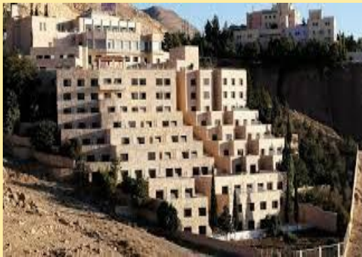
Hotel Panorama (Petra)